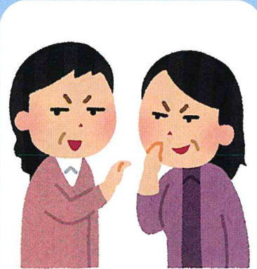
知らない人が自分のことを知っている