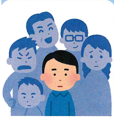
近所から監視されているように感じる

恋愛型ストーカー以外のストーカー犯罪があります。 あなたの気のせいや、偶然かもはもしかしたらこの犯罪に巻き込まれているサインかも