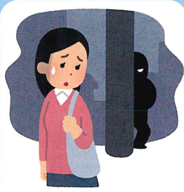
不特定の多数の人に待ち伏せや尾行されている