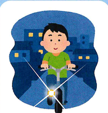
車や自転車のライトを当てられる