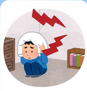
隣近所の騒音が酷い