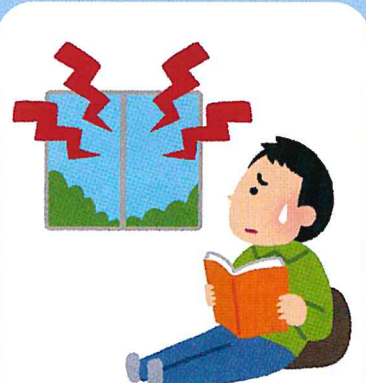
自宅・外出先で大声や物音で騒がれる