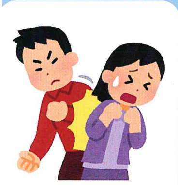
道行く人に避けているにもかかわらず体当たりされる